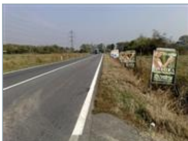
CAPONAGO (MI) S.P. 13